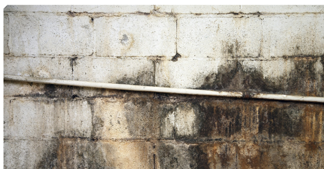
■ Humedades y microorganismos sobre soporte