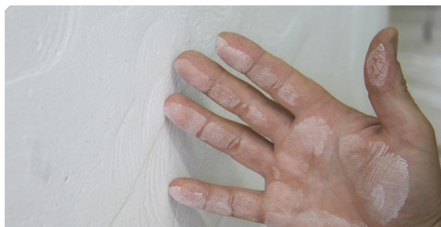
■ Soporte pulverulento.