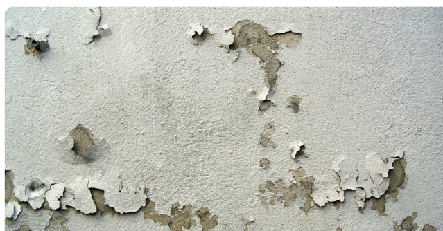
■ Fondo viejo mal adherido