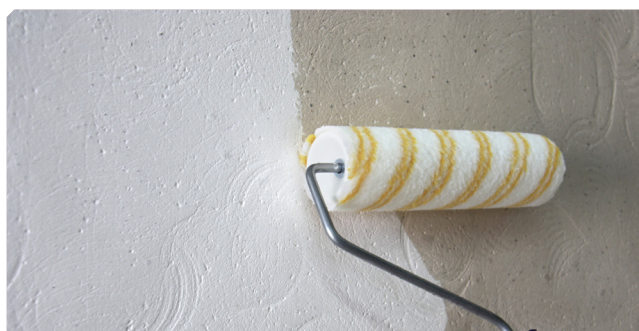
■ Imprimación del soporte con FIJAPREN AL DISOLVENTE